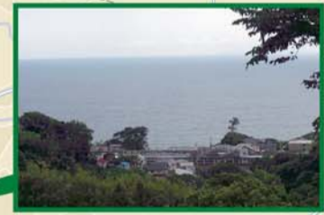
眼下に国府津駅と海が広がる。