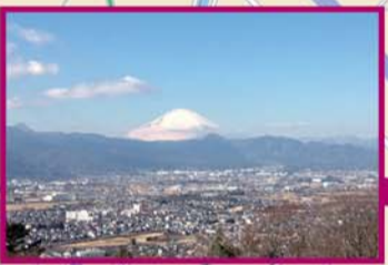
見晴台からの眺め。