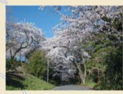
桜の季節、訪れたい沼代桜の馬場。上町隧道、六本松跡から約2キロ。