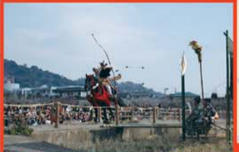
御殿場線沿いにある原梅林では2月中旬頃、流鏝馬が行われる。